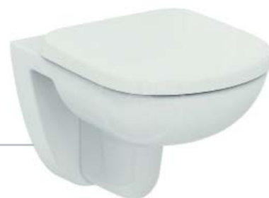
TEMPO ZÁVĚSNÝ KLOZET ze slinutého keramického střepe. Glazováno pod kruhem. Hluboké splachování.