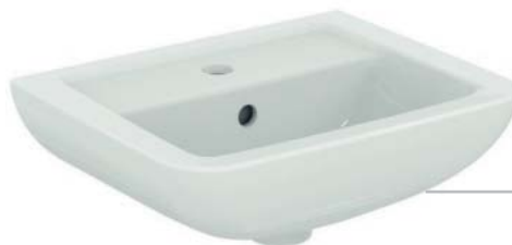
EUROVIT+ UMYVADLO Z JEMNÉ ŽÁROHLÍNY v šířkách 60, 55 a 35 cm