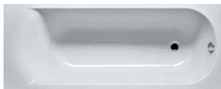
Vana s výpustí v čele pro dům A v rozměru 180×80 cm...